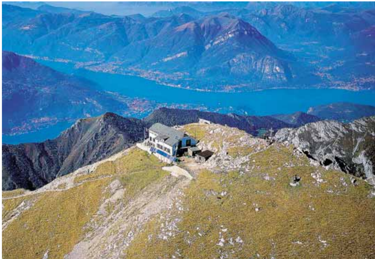
La Capanna Brioschi. A sinistra: il rifugio sul Grignone d'inverno

Spicca una bella foto aerea del rifugio Brioschi, in vetta alla Grigna Settentrionale, sulla copertina del numero di settembre di Orobie, che è in edicola da questa mattina. Come ben sanno i lettori della nota rivista, da qualche anno a questa parte il numero di settembre di Orobie è disponibile con un notevole anticipo: addirittura da Ferragosto. Una scelta della redazione, che in questo modo si rivolge ai numerosi lombardi in vacanza nelle valli bergamasche e delle province vicine proponendo gite ed escursioni prima di rientrare in città.